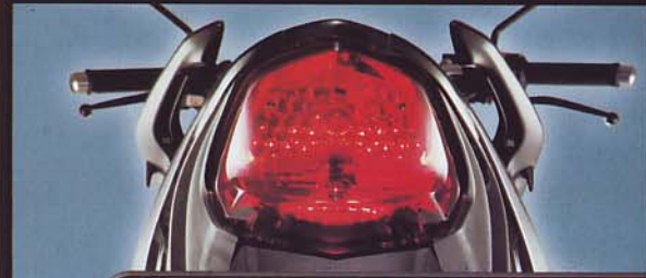
New Taillight Design: Tampil lebih sporty.