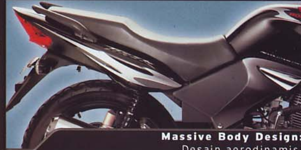
Massive Body Design: Desain aerodinamis.