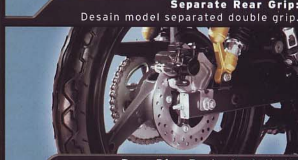
Rear Disc Brake Installed*: Cakram piston tunggal.