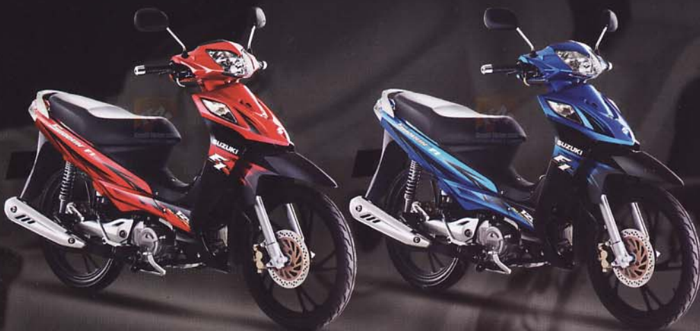
Titan Black Autumn Red