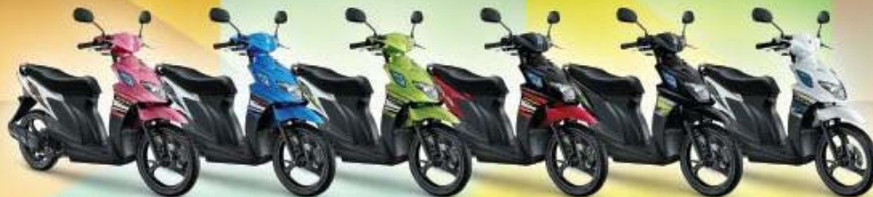
PEARL SAKURA PINK - BRILLIANT WHITE