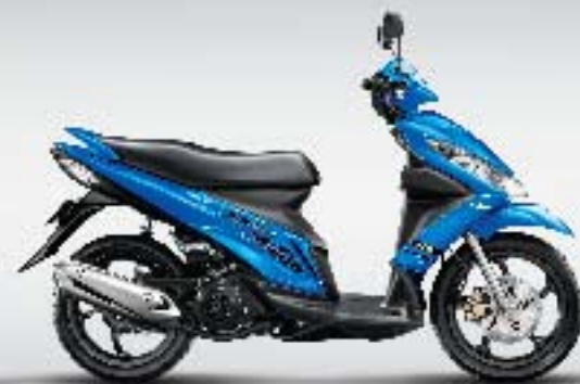
▶ Marine Blue