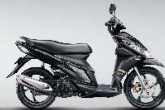
▶ Titan Black