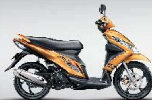
▶ Majestic Gold