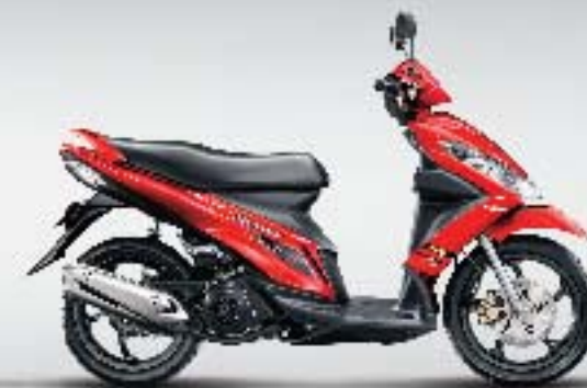
▶ Summer Red