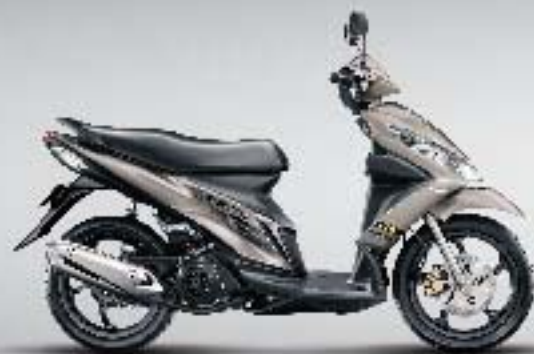
▶ Metallic Titanium Silver