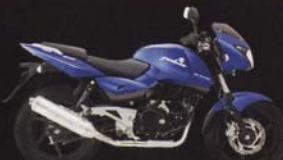
Long Beach Blue