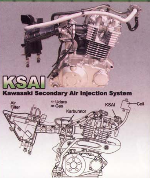
KSAI Kawasaki Secondary Air Injection System

Teknologi KSAI ( Kawasaki Secondary Air Injection System ) membuat KLX150S Ramah Lingkungan dari sisi emisi gas buang sesuai Standar EURO 2 , serta membuat pembakaran gas Ekonomis / Irit.