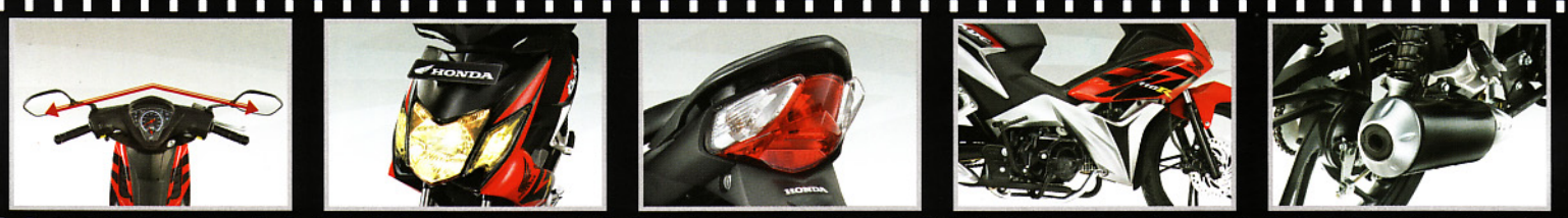
RACING STEERING POSITION

Mesin generasi terbaru 110 cc yang lebih tangguh, bertenaga, ekonomis serta ramah lingkungan!