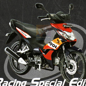
Racing Special Edition